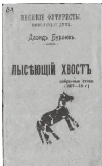
Сборник стихов Д. Бурлюка