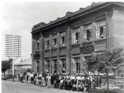
Здание 5-го мужского училища

ристы Каменский, Маяковский, Северянин. Пророчество гения. Отделение второе. Поэзо-концерт. Игорь Северянин — поэты. Маяковский — сказки. Хлебников — футуристы. Давид Бурлюк — стихотворения, Каменский — разбойничьи песни». Выставка картин, акварелей, рисунков и книг разместилась в коридорах училища, вход на неё был бесплатным с 12 до 4 часов дня и вечером с 6 часов. Концерт начинался в 8 часов вечера, и он был платным. На сцене Бурлюк выглядел весьма импозантно — белый жилет, элегантный смокинг, широкие шаровары и охотничьи сапоги, в глаз был вставлен монокль, в петлице смокинга красовалась великолепно раскрашенная деревянная ложка. Он начал вечер лекцией о футуризме, говорил прекрасно, заинтересовал даже принципиальных противников футуризма, а тех, кто увлекался футуризмом, также людей мало знакомых с историей литературы Бурлюк просто загипнотизировал. Он словно из рога изобилия сыпал меткими афоризмами, эпиграммами великих людей прошлого и настоящего — Достоевского, Короленко, Ренана, Гете, Шекспира и других, в то же время объявляя, что их произведения годятся только для «музея мертвецов». Убеждал публику, что футуристы — пророки русской революции и подлинные представители революционной демократии. После лекции Бурлюк начал читать свои стихи, в том числе «Лето», которое слушателями было признано совершенно бессмысленным.