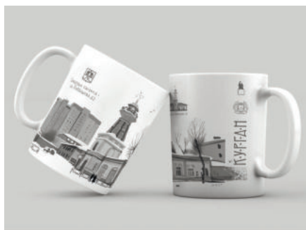
Проект «Метакурган». Дизайн кружек