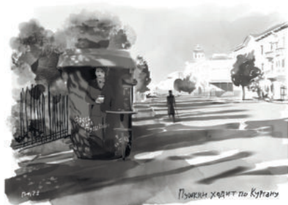
Открытка из серии «Пушкин бродит по Кургану»

становятся человечнее и ближе нам, вызывая теплые дружеские чувства и улыбки. Это касается, прежде всего, серий «Пушкин бродит по Кургану» и «Декабристы-оптимисты». Просто замечательные откровения художника — добрые, веселые, оригинальные и неподражаемые!