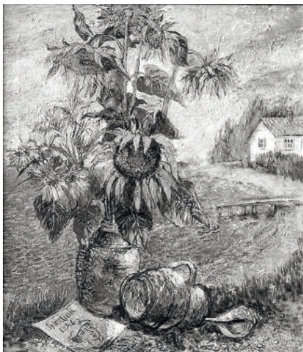
Д. Бурлюк «Натюрморт»