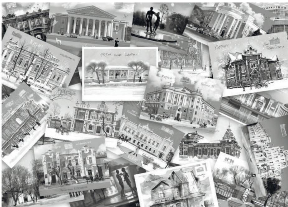
Открытки из разных тематических серий проекта «Метакурган»