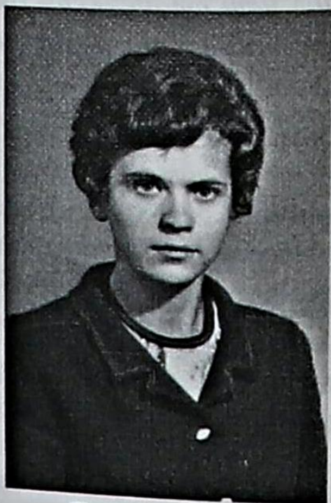
Я в 20 лет

Как много было нас, мальцов, В войну отвыкших от отцов, Нас на руках не нашивали, С нас только спрашивали, спрашивали.